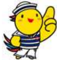
兵庫県マスコットはぼタン